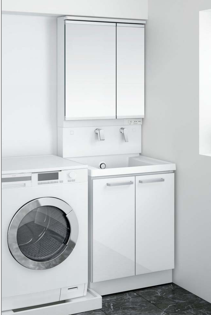
間口750mmプランイメージ